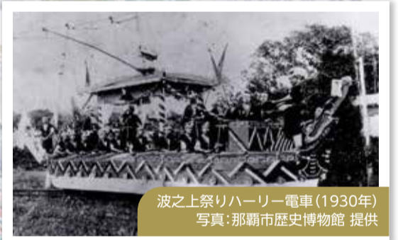
波之上祭りハーリー電車(1930年)