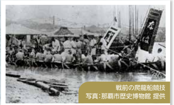
戦前の爬龍船競技