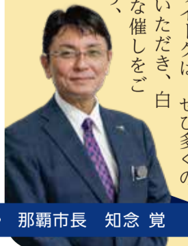
那覇市長 知念 覚

一致団結、力の限り漕ぎ進め! はいさい。今月号は、4年ぶりに開催される「那覇ハーリー」について紹介します。 那覇ハーリーは、県内ハーリー行事の中では最大規模を誇り、那覇三祭りの一つに挙げられます。そのハーリーは、約600年前の琉球王朝時代に中国から伝わったとされており、爬龍船を漕ぎ競い合い、漁の安全や豊漁を祈願する沖縄の伝統行事です。 県内各地のハーリーが漁労用のサバニを用いて競漕するのに対し、那覇ハーリーは全長14・5メートル、重さ2・5トンの爬龍船を用い、漕ぎ手32名、舵取り2名、鐘打ち2名、旗振り3名、中乗り2名、唄歌い1名の総勢42名による力強い競漕が魅力です。 今年のゴールデンウィークは、ぜひ多くの皆様に会場へお越しいただき、白熱したレースや多彩な催しをご堪能くださいますよう、うにげーさびら。