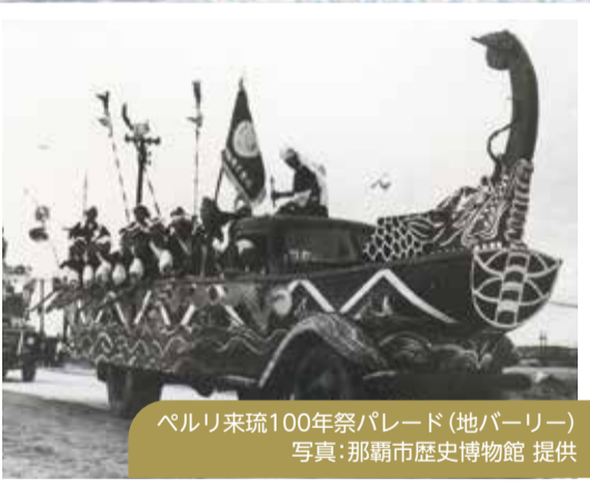
ペルリ来琉100年祭パレード(地バーリー)

ゆっくりと漕ぎ、旗を水平に振ります。また、泊・那覇・久米のそれぞれ地域の持つ「ハーリー歌」を歌うのが特徴です。