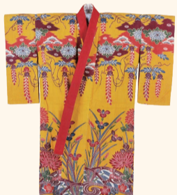
黄色地松皮菱 菊藤菊流水菖蒲文様 紅型木綿袴衣装

那覇市歴史博物館(パレットくもじ4階) 開館時間▼10時〜19時 休館日▼木曜 観覧料▼一般350円(大学生以下無料) ☎869-5266 FAX869-5267