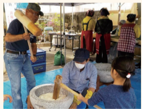
もちつき大会の様子(令和2年)

3年ぶりにもちつき大会を開催します。当日はもちつき体験とともにきたての美味しいおもちが無料でふるまわれます。(数に限りがあります。ご了承ください。)