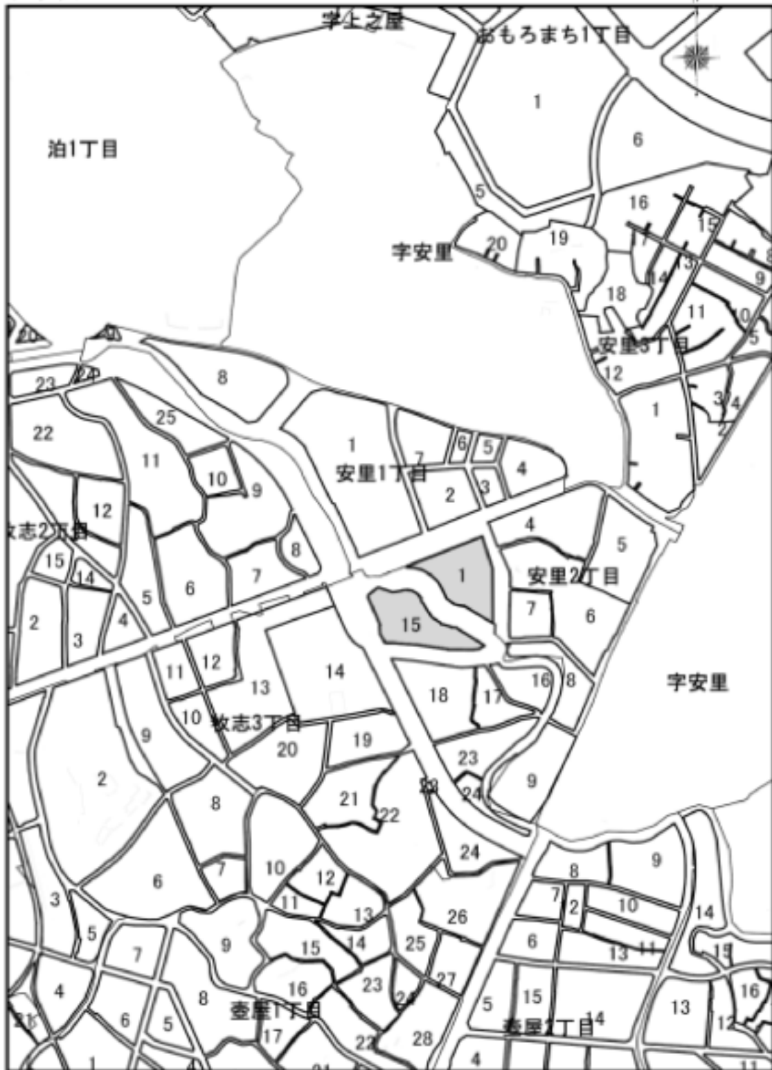
街区の区域廃止及び街区の区域変更位置図 (廃止・変更後)