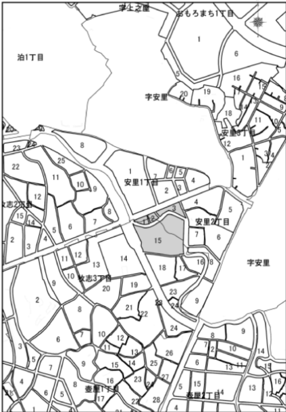
街区の区域廃止及び街区の区域変更位置図 (廃止・変更前)