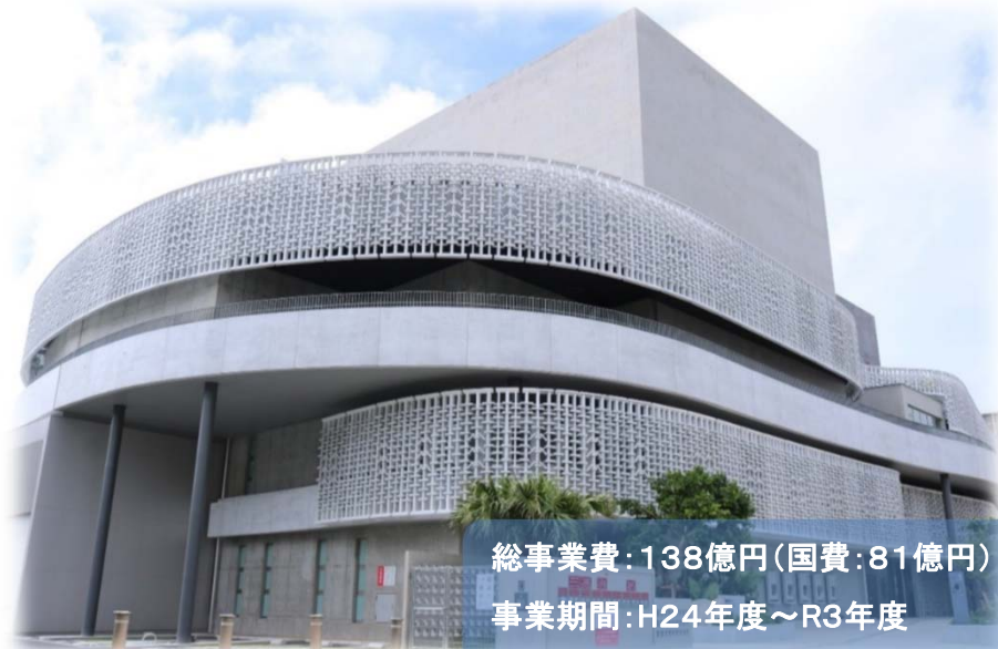
那覇文化芸術劇場 なは一と

振興や観光振興などに役立つ人材の 民の学習・交流活動を支援するた 那覇市人材育成支援センターまーい aha」を整備しました。