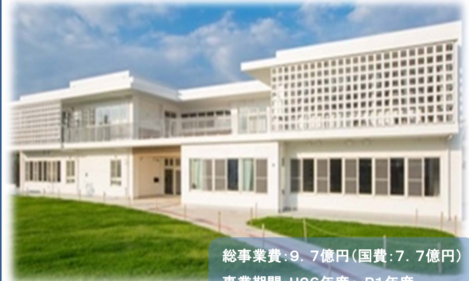
那覇市人材育成支援センター まーいまーいNaha