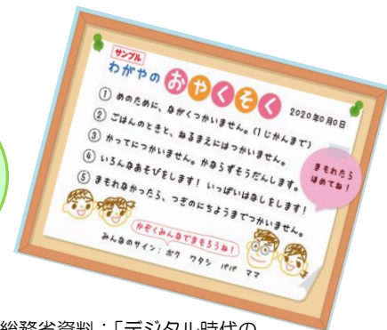
総務省資料：「デジタル時代の 子育てを一緒に考えてみよう！」