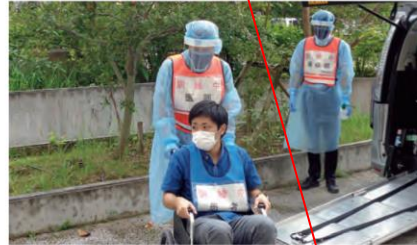
健康危機管理訓練