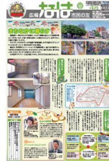
広報なは 市民の友