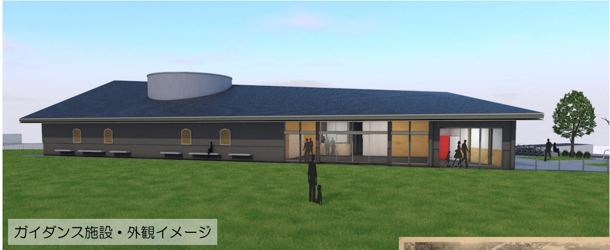
ガイドンス施設・外観イメージ