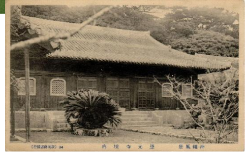
戦前の崇元寺本堂