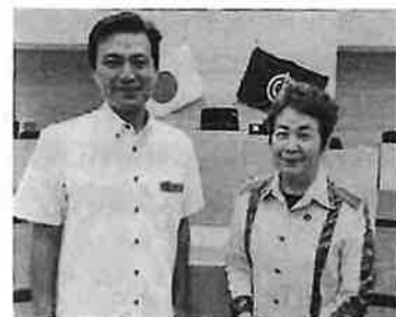
キャン市議に多和田の後継としてバトンタッチします。

答 これまでパレードが実施されてきた経緯や意義をふまえ、どのような形で開催できるか協議していきたい。