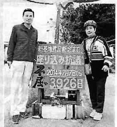
キャン幸容さんと一緒に