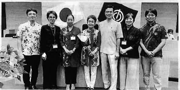
議員最後の日 会派の皆さんから花束をもらいました。