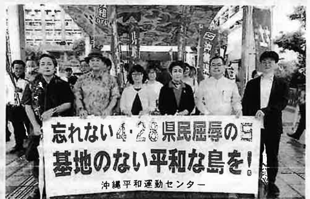
平和運動センター共同代表としての活動の様子です