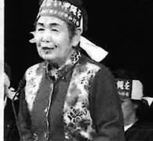
平和運動センター共同代表として5.15回結団式にてあいさつ