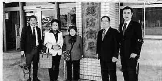
沖縄防衛省へ米兵による女性暴行事件への抗議要請(社民党)