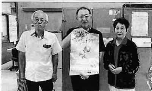
学校保護司として社会を明るくする運動の作文依頼を喜久川校長へお願いする。(城北中)