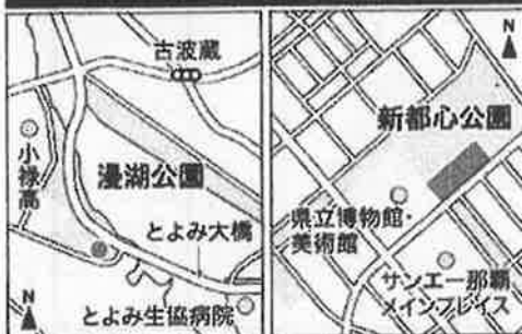
出典：2024年3月14日開催の「パークPFI」導入へ、民間参入の促進と施設設置や整備に活用