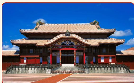
国営沖縄記念公園（首里城公園）：首里城正殿