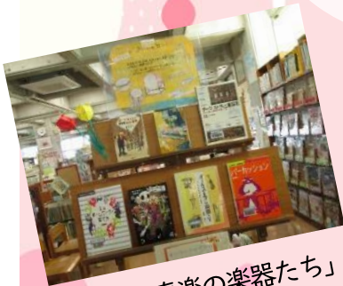
↑特集「吹奏楽の楽器たち」

1/28(水)~1/30(金)の期間、 中学生の職場体験がありました! 特集コーナーの作成やリサイクル本の 準備などを行いました。