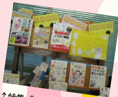
↑特集「上手な絵の描き方」