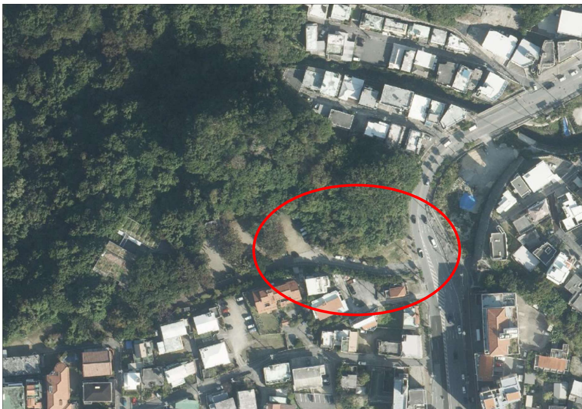
【末吉公園駐車場（儀保交番側）管理範囲（赤色部分）（non scale）】