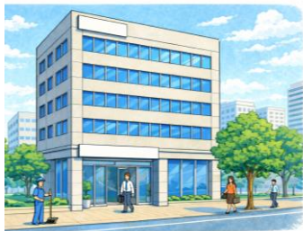
ビル管法関係 (特定建築物・事業登録)