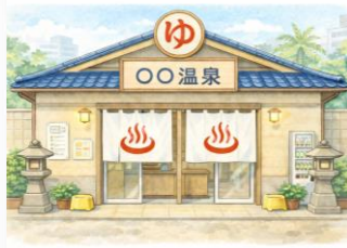
公衆浴場、温泉施設