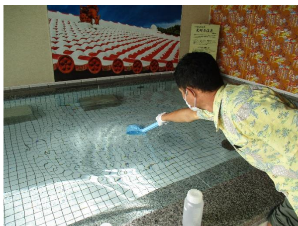
浴槽水採水の様子