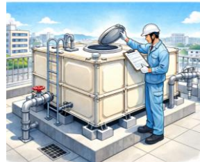
水道施設 (専用水道・簡易専用水道)