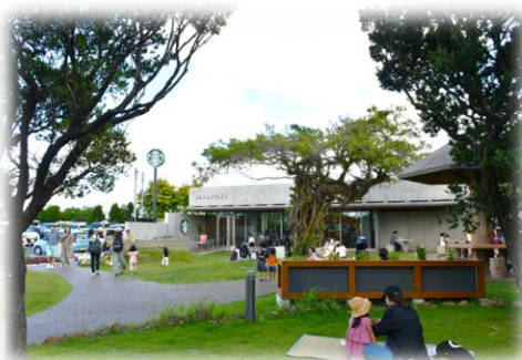
▲日常のほどよいにぎわいの例 (漫湖公園鏡原側)