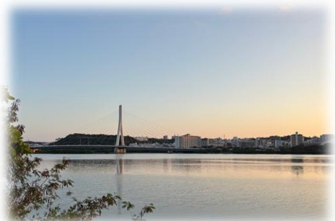
▲漫湖公園から見る国場川の眺望

今回の再整備では、大規模な施設整備や集客を主な目的とした「にぎわい」ではなく、公園を利用するすべての人にとっての日常的な安心感につながる、「ほどよいにぎわい」を目指すことといたしました。