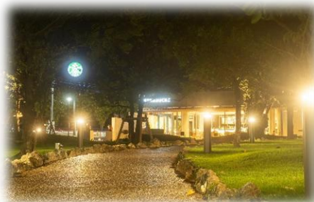
▲店舗と照明による明るさの確保 (漫湖公園鏡原側)

さらに、アンケートでは「人目が少なく不安」、「見通しが悪く夜間が暗くて怖い」といった声も多く寄せられました。