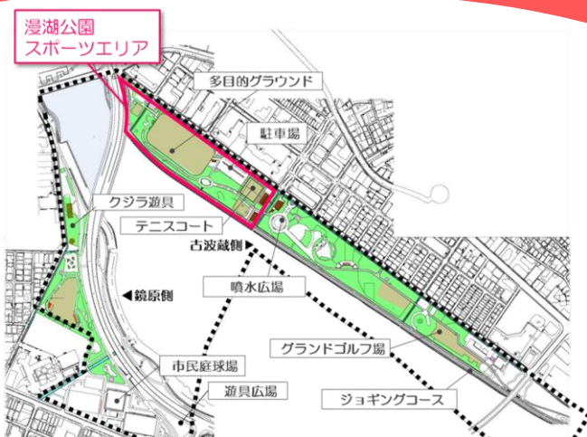
▲漫湖公園スポーツエリアの位置

今回の方向性決定について、 ご意見やご感想がございましたら、 こちらまでお願いします。