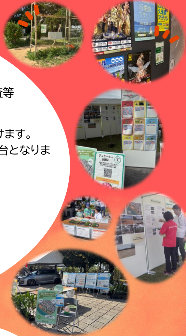
▲アンケート調査の様子