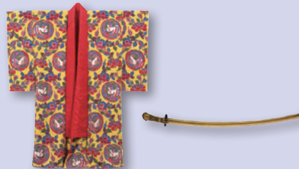
▲黄色地鳳凰牡丹 文様紅型縮緬袷衣裳