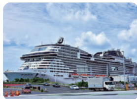
クルーズ船の受入れ