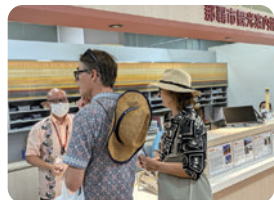
観光案内所での外国人対応