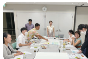
市民向けワークショップの実施