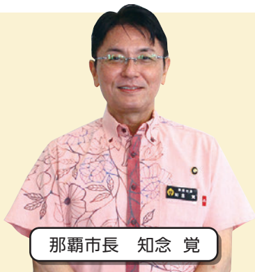
那覇市長 知念 覚