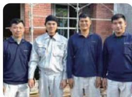
外国人の雇用促進