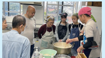
▲ゆし豆腐作り体験の様子