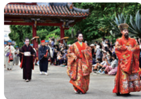
歴史・文化イベントでの誘客