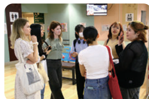
国際交流の機会の造成