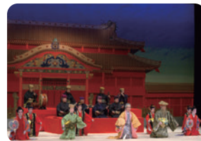
琉球文化の保全・継承