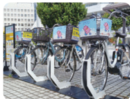
市内シェアサイクルの促進