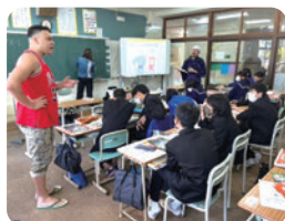
未来の担い手の育成