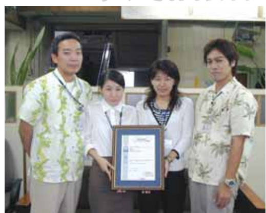
9月10日に市民課三支所・市民活動課が品質システム登録証を受けました。

ISO9001とは お客様に満足していただける製品やサービスを提供し、継続的改善を行うためのシステムです。