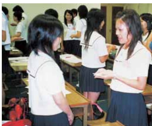
那覇商業高校で行われた「那覇市高校生就職支援講座」

市では、就職を希望する方だけなく、雇い入れる企業に「若年者雇用安定化推進事業」も行なっています。若年者(30歳未満)の雇用安定を推進するために、若年者を雇用した事業主に對して奨励金を支給する制度です。