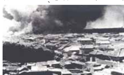
辻原から見た炎上している那覇港一帯

昭和19年10月10日の早朝、当時の小禄飛行場や那覇港が空襲に遭いました。その後、5波にわたって空襲が続き、260名の尊い生命が奪われ、旧那覇市内の9割までもが消失しました。 市では、60年という節目の年であり、飛行場や港を望めるがじらんびら公園で、戦争の風化を防ぎ、次代までも記憶するために「十・十空襲60周年・市民の集い」を開催します。なお、当日