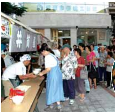
1950年ごろ、国際通りにあった沖縄そばの老舗井筒屋のそば。300食は、「あっ」と言う間に売り切れてしまいました。

沖繩ちんどん屋同好会を先頭に、各通り会、(株)沖繩ファミリーマート、FC琉球、市民ボランティアNPO、市職員など約590人が参加し、市内各地を清掃しました。 清掃活動は、国際通り周辺など市内6か所に分かれて、行われました。 参加者は、大粒の汗をかきながら路上に落ちていたタバコの吸殻や空き缶、ゴミなどを拾いました。