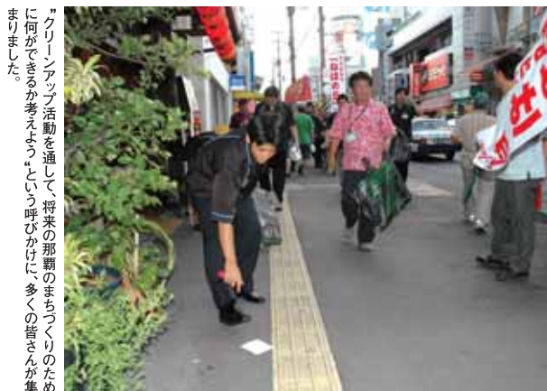
「クリーンアップ」活動を通して、将来の那覇のまちづくりのために何ができるか考えよう、という呼びかけに、多くの皆さんが集まりました。