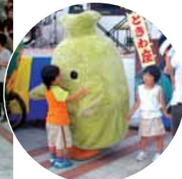
かわいい「キッコロ」に子どもたちも大喜び。

伝説の井筒屋のそばを今年も3000食限定で販売。会場では、チケットを求める長蛇の列が出現しました。