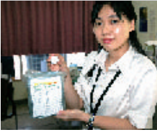
新庁舎建設室に設置されたペットボトルのキャップ回収箱

さて、平成20年度のエネルギー使用量などの実績については、上記の表のとおりとなっていますが、基準年度である平成18年度と比較すると、大幅に増加している項目があります。これ