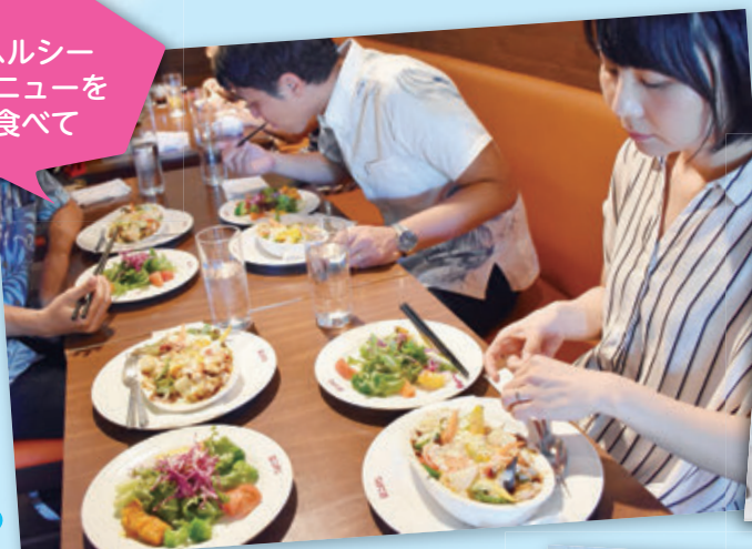
協力：食飲工房こばやし