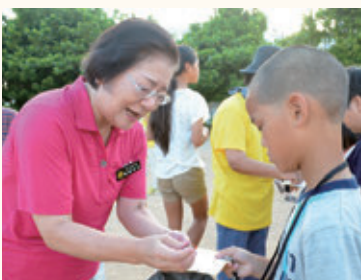
夏祭りで使える券を獲得するためラジオ体操をがんばる子どもたち(曙小学校)