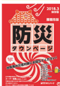
図 タウンページセンター ☎ 0120・506309