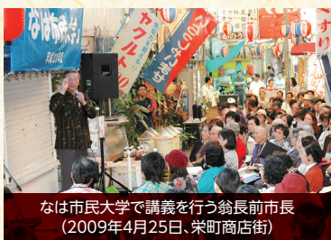
なは市民大学で講義を行う翁長前市長(2009年4月25日、栄町商店街)

私たちは、翁長前市長のご功績を引き継ぐとともに、氏が全力を注がれた「協働によるまちづくり」をさらに推進し、那覇市の発展に努めていかなければならないと強く思っています。