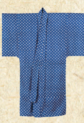
紺地左三ツ巴紋 散文様 藍型芋麻衣裳