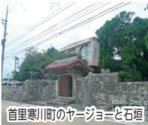
首里寒川町のヤージョーと石垣