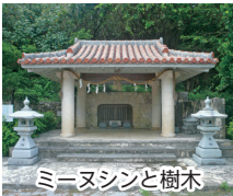
ミーヌシンと樹木

那覇市都市景観条例第25条「都市景観の形成上重要な価値があると認められるものについて、都市景観資源として指定することができる」に基づき、今年度新たに4件の指定を行いました。