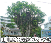
山川自治公民館のガジョマル