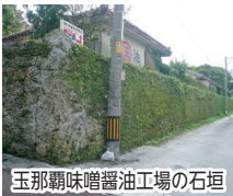
玉那覇味噌醤油工場の石垣