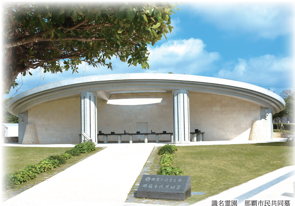
識名霊園 那覇市民共同墓