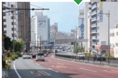
車の通りが多くなってきた泊交差点。この頃はまだ右側通行（1960年代後半）