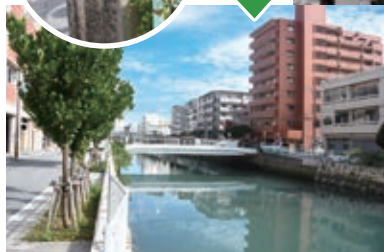
安里川の仮橋（現在の中の前島小学校（1957年）の橋）。後ろは開校間近の前島小学校（1957年）