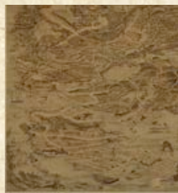
首里那覇鳥瞰図屏風

琉球船と首里・那覇を描いた絵画史料「目の前に広がるかつての首里・那覇」18世紀以降、琉球王国においても高いところから広範囲を描く手法「鳥瞰図」により首里・那覇が描かれ、地図とは異なる形で、往時の様子を我々に伝えていきます。 首里を描いた鳥瞰図では、主に首里城が題材に取り上げられ、城の詳細な様子がわかります。那覇を描いた鳥瞰図では、港を中心に、進貢船の入港、爬龍船競争、それを見物する多くの人々が描かれています。 企画展では、首里・那覇の鳥瞰図や琉球船が描かれた絵画を一堂に展示し、併せて戦前の首里・那覇の写真を紹介します。絵画や写真をとおして、琉球王国時代の首里・那覇を想像してみてください。