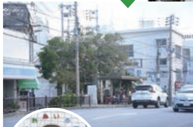
開南交番（中央の瓦ぶき建物）周辺。現在の開南バス停留所（1960年代）