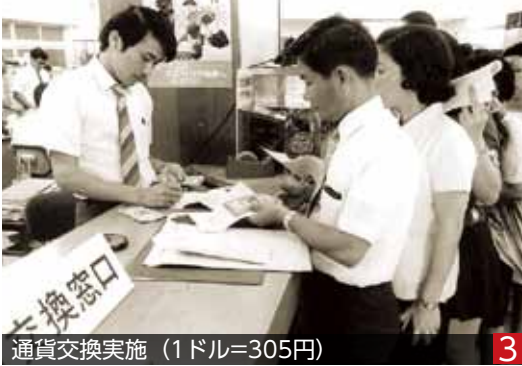
通貨交換実施 (1ドル=305円)