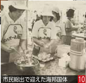
市民総出で迎えた海邦国体