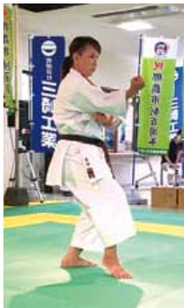
▲演武大会で空手の型を披露する選手

那覇市緑化センター講習室にて、那覇市市制100年の歩みとして写真の展示を5月1日(土)より公開します。また、5月15日(土)にはウマハラシと古武術についての講話、演武大会を開催します。華麗な演武を、ぜひご覧ください。 写真展示 ▼5月1日(土)～5月31日(月) 講話・演武大会 ▼5月15日(土) 10時～16時 場所▼那覇市緑化センター (有)三崎工業 ☎090・5022・7224