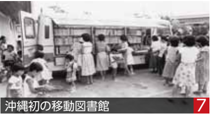
沖縄初の移動図書館