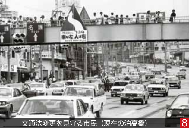
交通法変更を見守る市民 (現在の泊高橋)