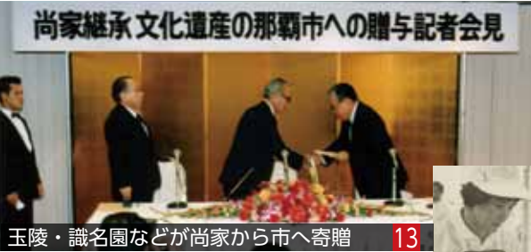
玉陵・識名園などが尚家から市へ寄贈