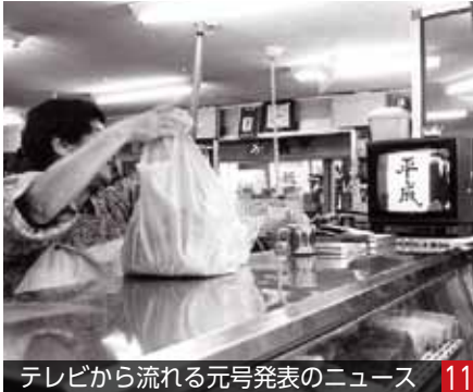
テレビから流れる元号発表のニュース