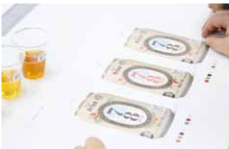
▲サンプルデザイン

単なる建物では面白みがない、もっと那覇らしさをと考える行き着いたのが那覇のメインストリートである「国際通り」。国際通りは、昔から様々な店が並び、多くの人々の交流の場として親しまれる、那覇を代表する名所の一つです。