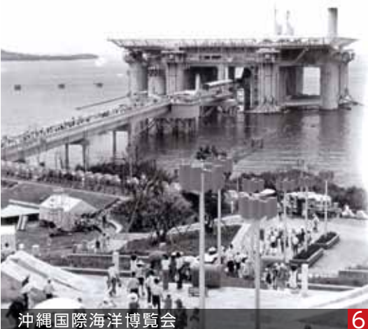
沖縄国際海洋博覧会