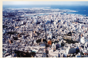
発展を遂げる那覇市街