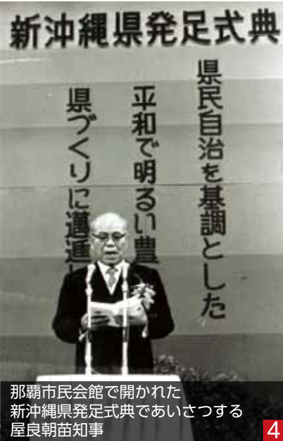
那覇市民会館で開かれた新沖縄県発足式典であいさつする屋良朝苗知事