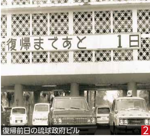
復帰前日の琉球政府ビル