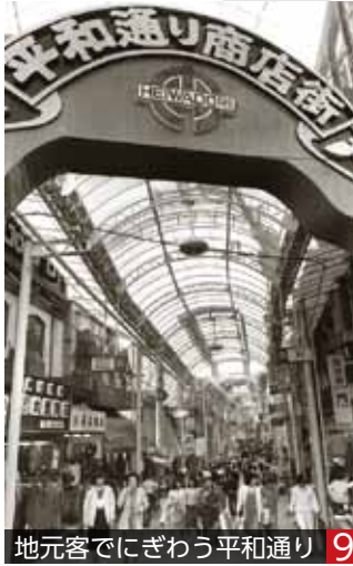
地元客でにぎわう平和通り