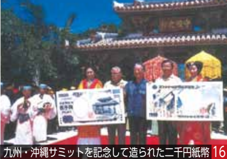
九州・沖縄サミットを記念して造られた二千円紙幣