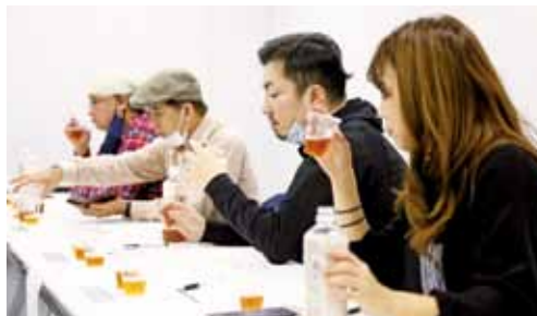
▲味比べを行う参加者