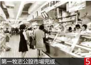
第一牧志公設市場完成