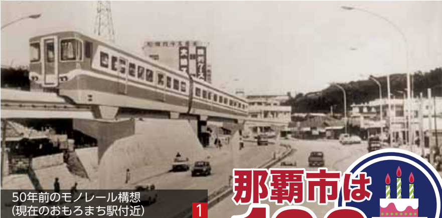
50年前のモノレール構想 (現在のおもろまち駅付近)