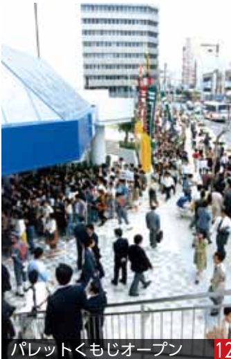
パレットくもじオープン