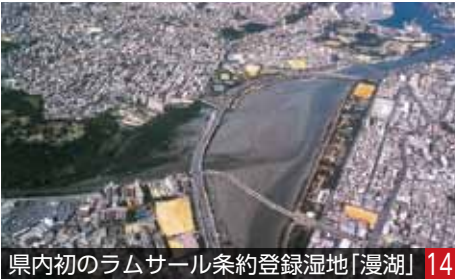
県内初のラムサール条約登録湿地「漫湖」