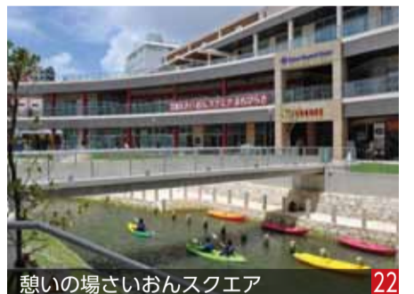
憩いの場さいおんスクエア 22