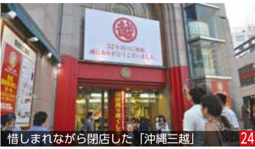
惜しまれながら閉店した「沖縄三越」 24