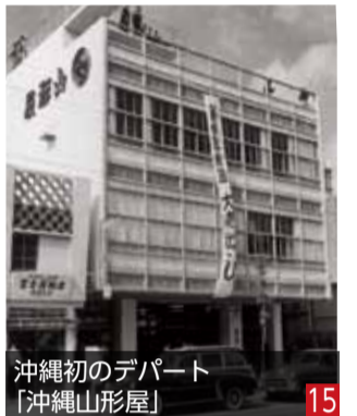
沖縄初のデパート 「沖縄山形屋」 15