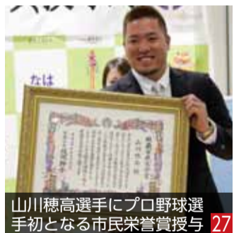
山川穂高選手にプロ野球選 手初となる市民栄誉賞授与 27