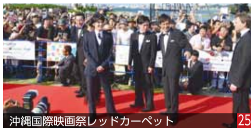
沖縄国際映画祭レッドカーペット 25