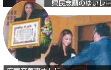
安室奈美恵さんに 歌手初の市民栄誉賞授与 17