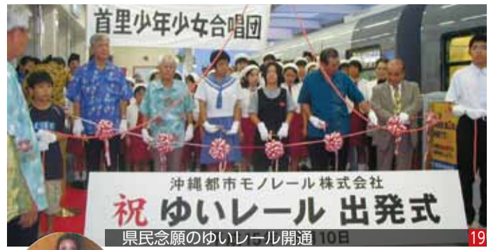
沖縄都市モノレール株式会社 祝 ゆいレール 出発式 県民念願のゆいレール開通10日 19