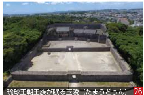
琉球王朝王族が眠る玉陵(たまうどうん) 26