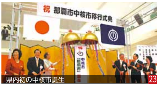
県内初の中核市誕生 23