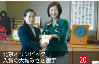
北京オリンピック 入賞の大城みさき選手 20