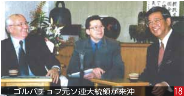
ゴルバチョフ元ソ連大統領が来沖 18