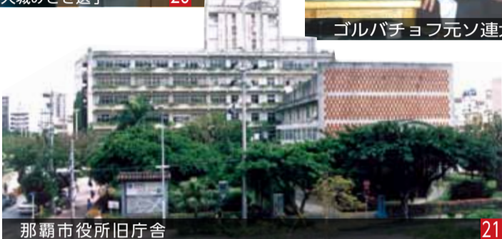
那覇市役所旧庁舎 21