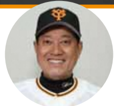
原 辰徳 監督

昨年は、ジャイアンツにとって非常に悔しいシーズンになりました。選手、コーチ、そして私もこの悔しさを胸に刻んで、新たにステップアップしていく所存です。長いペナントレースでは苦しい場面も訪れますが、困難を糧として、「不屈」の精神で戦っていきます。