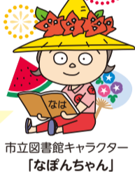
市立図書館キャラクター「なぽんちゃん」

はいたい「なぽんちゃん」です。「調べたい事があるけど、調べ方が分からない」「〇〇について書かれた本ってないかな」「戦後の古い新聞を見たい」こんな悩みや戦後の沖縄はどうだったのか知りたいと思ったことはありませんか？こんな時は、図書館がお手伝いします。図書館には、あなたの「知りたい」を調べてくれる職員がいます。お気軽にご相談くださいね！