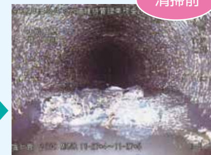
管内には土砂が・・・