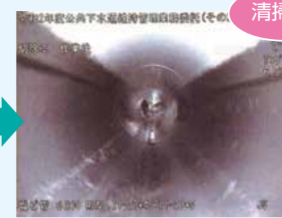
こんなにキレイになりました♪