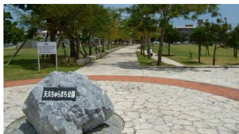
採水場所F (天久ちゅらまち公園)