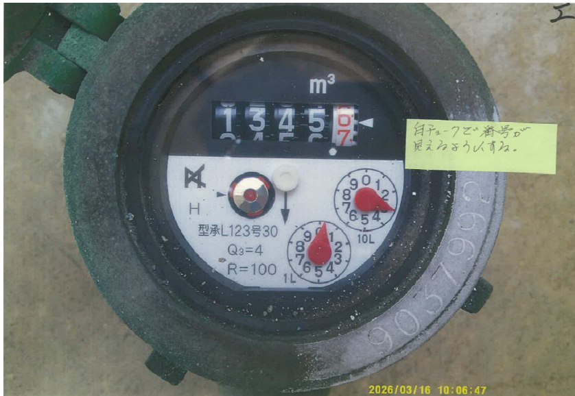
① 旧メーター番号、指針の確認 (番号が見えにくい時は、チョーク等で見えるようにすること)