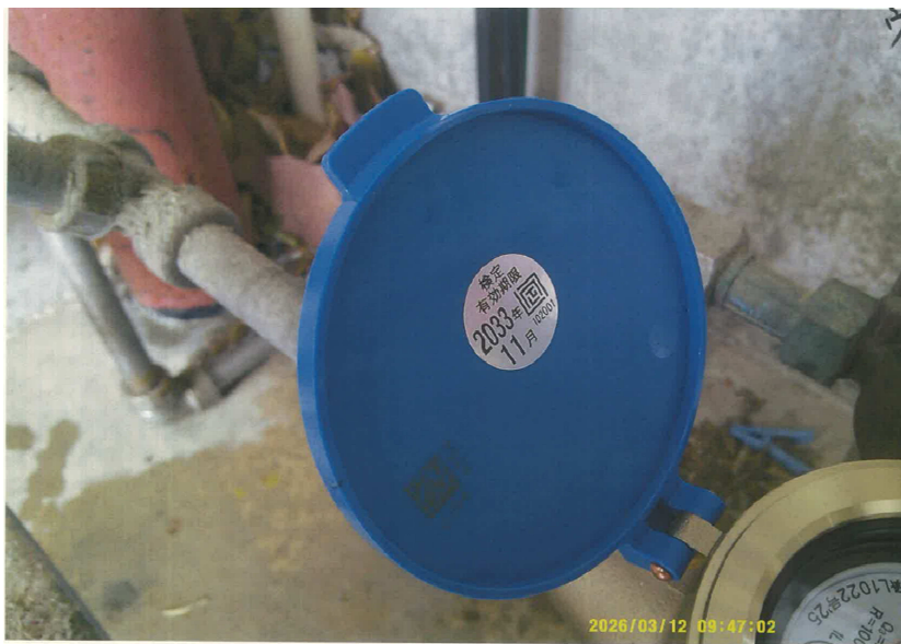
③ 新メーターの検定有効期限の確認