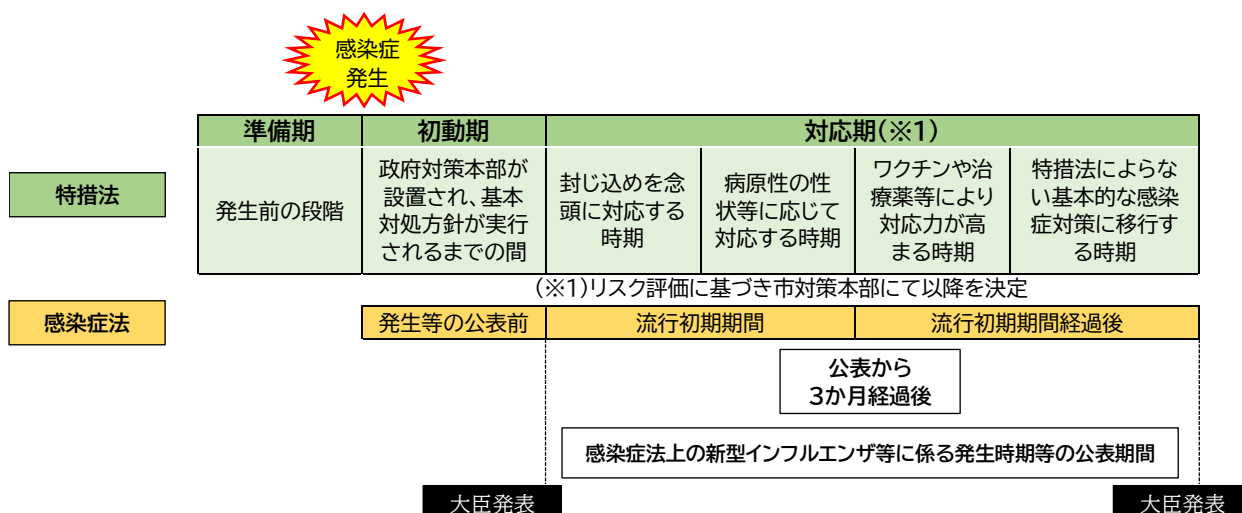
図表4 感染症危機における特措法と感染症法による時期区分の考え方(イメージ図)

具体的には、前述の(1)の有事のシナリオの考え方も踏まえ、感染症の特性、感染症危機の長期化、状況の変化等に応じて幅広く対応するため、初動期及び対応期を、対策の柔軟かつ機動的な切替えに資するよう図表4のように区分し、有事のシナリオを想定するとともに、時期ごとの対応の特徴も踏まえ、感染症危機対応を行う。