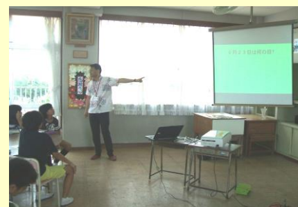
中学校社会科教諭による乗り入れ指導の様子 H28. 6. 28 於：松川小学校