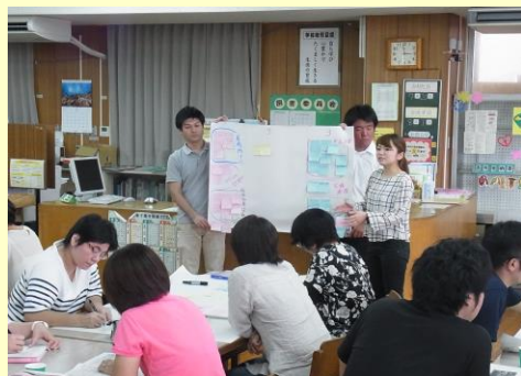
生徒指導対応のワークショップの様子（真和志中 G）