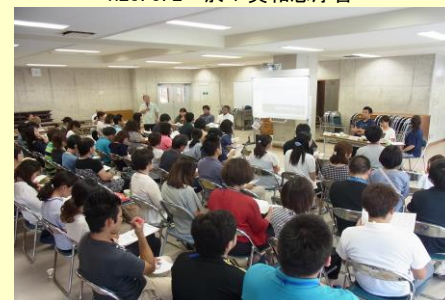
城北中グループ小中合同研修会の様子 H28. 7. 26 於：城北中学校