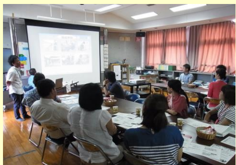
講話「生徒指導における小中連携」（石田中 G）