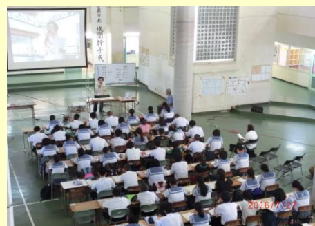
首里中学校リーダー研修会の様子 H28.7.27 於：首里中学校