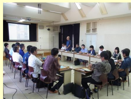
読谷村の校長・教頭への小中一貫教育の説明 H28. 7. 25 於：金城中学校