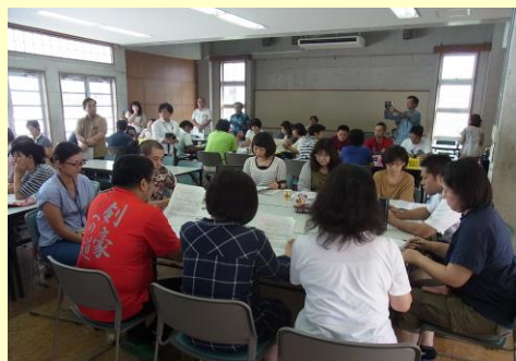
各学力調査の考察と対応策協議の様子（神原中 G）