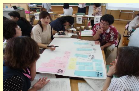
「ワークショップ型」授業研究会の様子 （那覇中グループ小中合同授業研究会） H28. 6. 21 於：那覇小学校