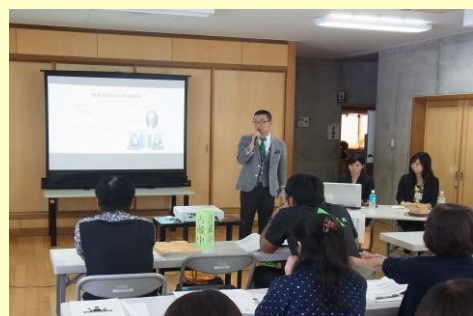
講話「IN-Childの教育的診断と支援」（古蔵中 G）