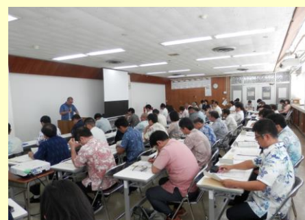
第 2 回教頭連絡会の様子 H28. 8. 2 於：真和志庁舎

小中一貫教育推進室では、教頭先生方と連携し小中一貫教育を通し児童生徒一人一人の個性や能力を伸ばし、生きる力を育むとともに、学力の向上、豊かな人間性や社会性の育成、小中学校それぞれにおける進級・中学校入学時の不安解消の取組をさらに充実させていきたいと考えております。各学校のご協力を今後ともよろしくお願いいたします。