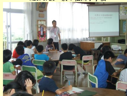
戦争時の生活について考える児童 H28. 6. 28 於：松川小学校