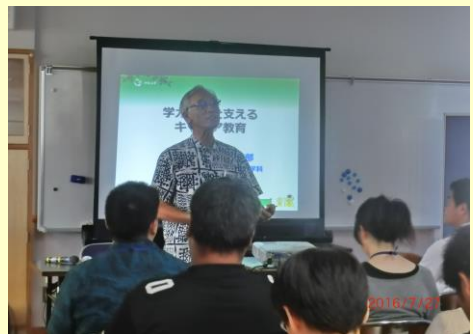
講話「学力向上を支えるキャリア教育の考え方、進め方」（寄宮中 G）