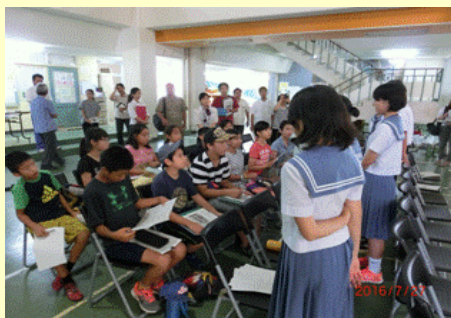
城西小学校・城南小学校の児童会のリーダー をお世話する首里中学校の生徒会役員