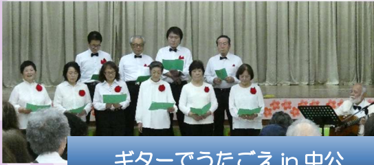
ギターでうたごえ in 中公