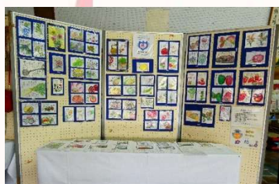
絵手紙サークル「結」