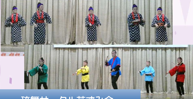
琉舞サークル花すみ会