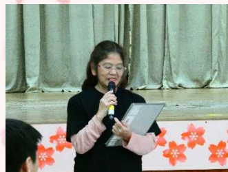
中央公民館利用団体連絡協議会 奥平会長あいさつ