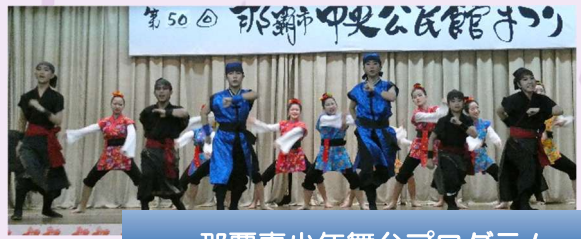
那覇青少年舞台プログラム