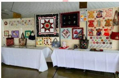
パッチワークサークル・キルトビー

展示作品はどれも力作揃い!皆さんの頑張りが伝わってきます。またサークル展示の他に、昨年同様環境政策課による「環境パネル展」も行われ、那覇市の環境に対する取り組みを紹介しました。