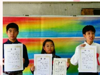
第2回那覇市図書館を使った 調べる学習コンクール表彰