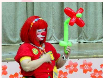
オープニング クラウンきららバルーンショー