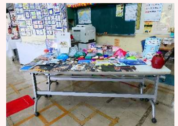
来館した子どもたちへの景品