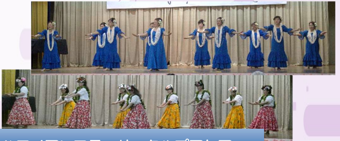
ハワイアンフラ・サークルプアケア