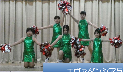
エヴァダンシア与儀