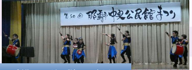
創作エイサー隊 天之川