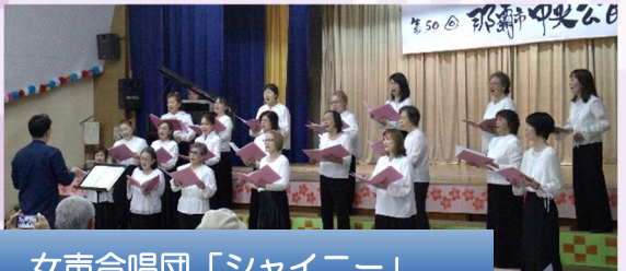
女声合唱団「シャイニー」