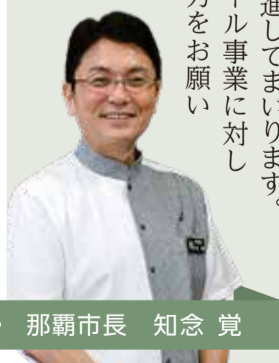
那覇市長 知念 覚