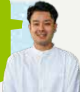
ゆいれーる利用者さん

昼からワインが飲みたくなるほど美味しい料理を楽しめます。店舗駐車場がないため、ゆいれーる利用がベスト！