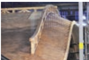
緩やかな曲線が美しい唐破風