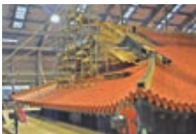
瓦葺(かわらぶき)工事中

素屋根では、昨年の12月に建方工事を終え、今年1月からは屋根の復元に入っています。垂木などの屋根材が施され、赤瓦が葺かれ、柱や壁の漆塗装と並行して、柱に色を塗る塗装工事や龍などの絵を描く彩色工事も行われます。唐破風妻飾りを支えるのが、正面に立つ向拝柱。うち、御差床左右の2本は職人さんによって直接柱に金龍や瑞雲などの吉祥文様が描かれます。来年には外部彩色、内部彩色、素屋根や木材倉庫の解体が予定されています。