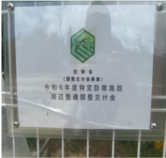
【防衛省と地域社会の協力を象徴するエンブレム】