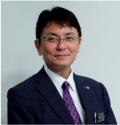
那覇市長 知念 覚