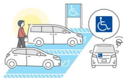
● 車椅子使用者用駐車施設

車いすの人など、乗り降りに広いスペースを必要とする人のために、一般の駐車区画よりも幅が広がっております。「入口に近いから」、「たくさん買うから」といった理由で駐車するのはやめましょう。