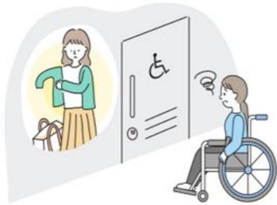
● バリアフリースイートイレ