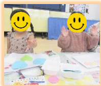
★お店屋さんごっこ準備&当日★