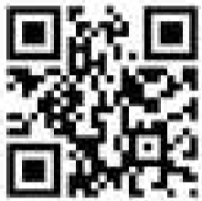
▲沖縄リサイクル運動市民の会 HP