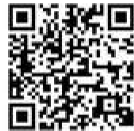
▲ボランティア募集中の団体情報QR

こういったボランティア団体があるのか、もっと知りたい方は、ぜひ左に掲載のQRコードより詳細をぜひご覧ください！