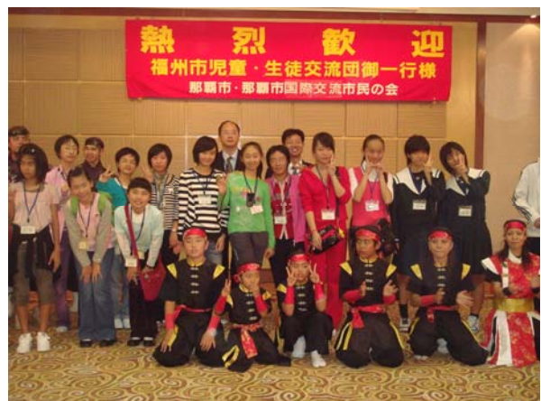
市民の会主催歓迎会