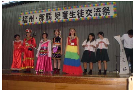
全体交流祭にて:伝統音楽と踊りを披露してくれました