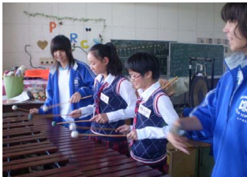
上山中学校プラスバンド部員と

2008年度は那覇市の児童生徒が福州市を訪問します。お互いの文化を理解することにより、次代を担う児童生徒が恒久平和の担い手として成長していくことを期待します。