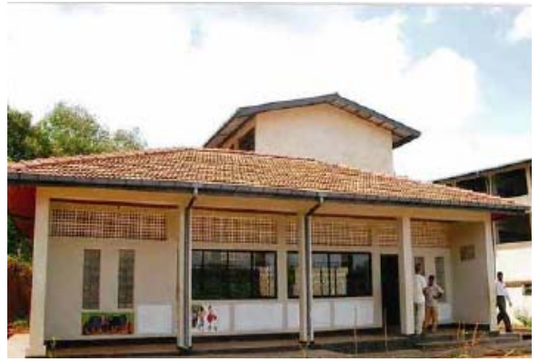
完成したスリランカの「ナハ・ライブラリー」(上)と カデナ・ハイスクールの生徒たち(下)

スリランカ全土では広く英語が使われており、基地内高校生たちからの温かい贈物が生徒たちの学習に大いに役立つことを願っています。