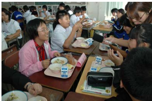
仲井真中学校生徒たちと仲良く給食