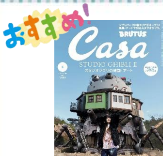
カーサ ブルータス Casa BRUTUS

住む、食べる、着るなどの情報が満載のライフスタイル・マガジン。「旬の暮らし」を提案。