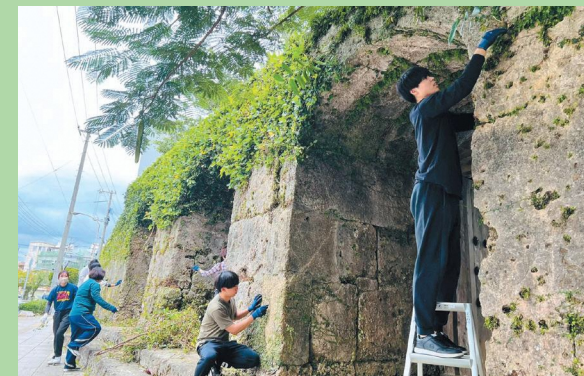
文化財保護のための美化活動