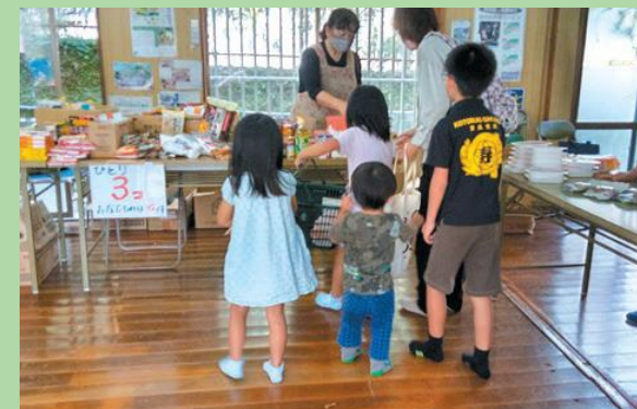
子どもの支援・居場所での活動