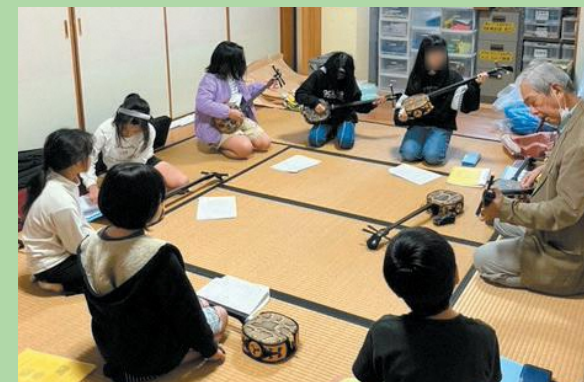
小学校の授業での三線の先生